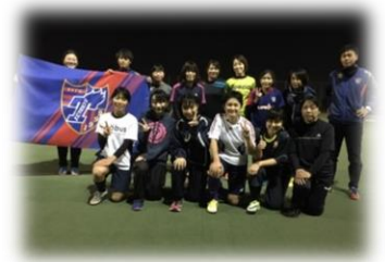
仲間たちが待ってます！♥

※中学生・高校生の方で初めて参加される方は、 別途保護者同意書のご提出をお願いしております。