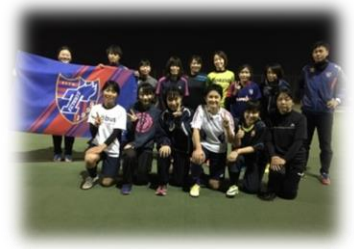
仲間たちが待ってます！♥

※中学生・高校生の方で初めて参加される方は、 別途保護者同意書のご提出をお願いしております。