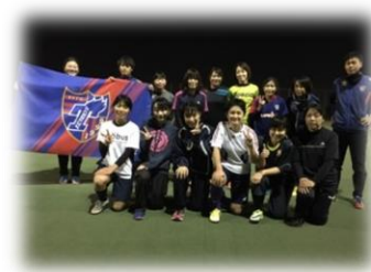
仲間たちが待ってます！♥

※中学生・高校生の方で初めて参加される方は、 別途保護者同意書のご提出をお願いしております。