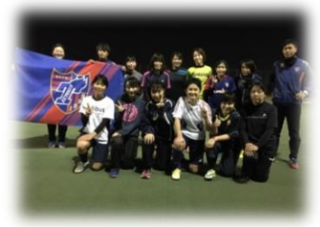
仲間たちが待ってます！♥

※中学生・高校生の方で初めて参加される方は、 別途保護者同意書のご提出をお願いしております。