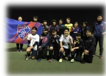
仲間たちが待ってます！♥

※中学生・高校生の方で初めて参加される方は、 別途保護者同意書のご提出をお願いしております。